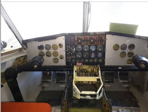
Le tableau de bord du Canadair A gauche tel qu'il était à l'origine (planches de bord Pilote et copilote manquantes à l'origine)