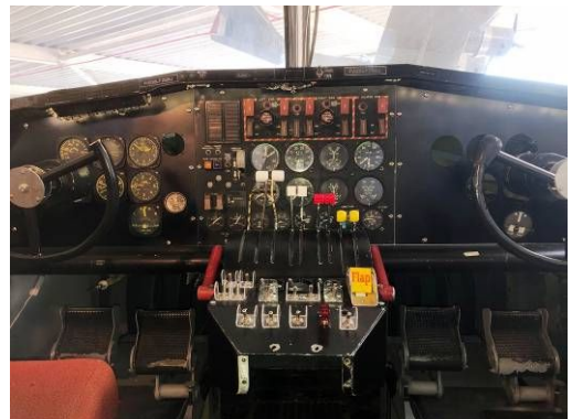
A droite tel qu'il est aujourd'hui. Avec la console centrale entièrement refaite (chaudronnerie et commandes, inter- rupteurs.....)