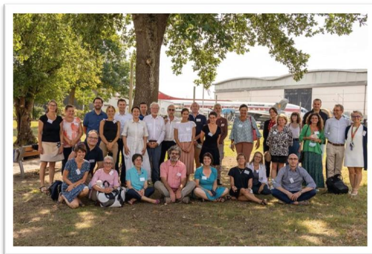
Rencontre entre les acteurs du projet PROCRAFT

l'établissement (3000 pièces) ainsi que les nombreuses épaves retrouvées dans le Lac de Biscarrosse-Parentis sont des outils d'étude et de mesure pour les expérimentations des scientifiques. La collaboration des équipes du Musée dans les recherches historiques et techniques facilite la compréhension de l'histoire des vestiges. Finalement, le musée est un laboratoire vivant pour les scientifiques et une structure d'accueil favorisant les échanges pluridisciplinaires (chercheurs, collectivités, associations, etc). Un rôle qui renforce les liens avec nos partenaires nationaux et internationaux au fur et à mesure des rencontres.